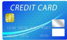
ISO/IEC7810 カードのサイズ (クレジットカードなど)