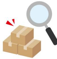
ISO9001 品質マネジメントシステム