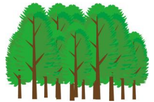
ISO14001 環境マネジメントシステム